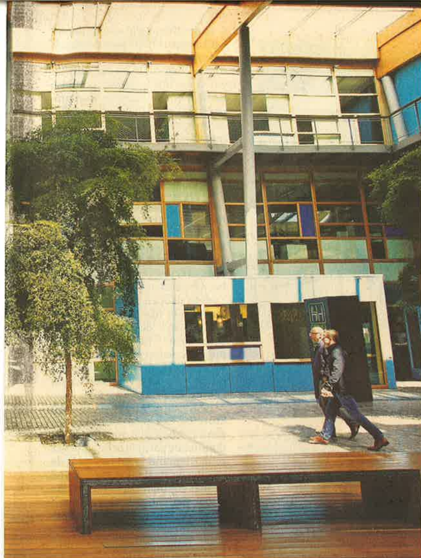
Links: het kantoor van Priva in De Lier. Onder: de meststofdoseerinrichting Nutrijet van Priva. Kijk op de site voor meer foto's